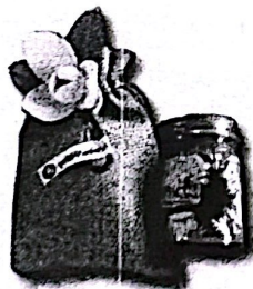
ถุงดอกกล้วยวน (บาร์มสมุนไพรรักษา) ราคา ๑๐๐ บาท