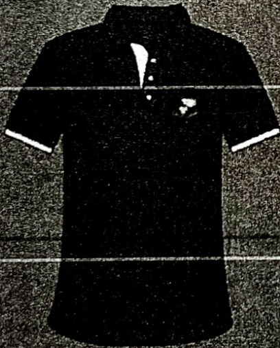
เสื้อดอกลำดวน