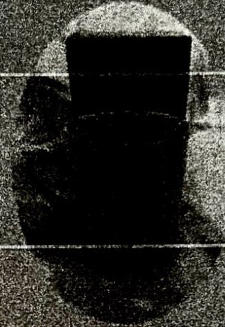
แก้ว Mug ดอกลำดวน