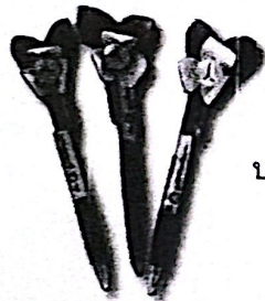
ปากกาดอกกล้วยวน ราคา ๓๐ บาท