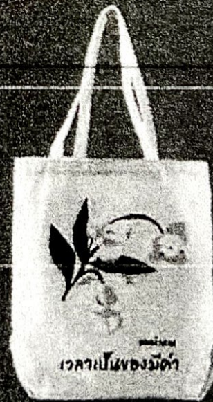
กระเป๋าผ้าดอกลำดวน