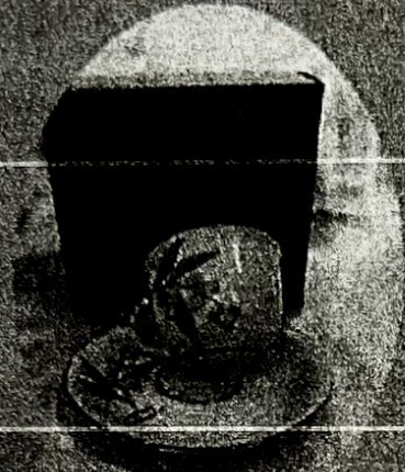
แก้วกาแฟพร้อมจานรอง