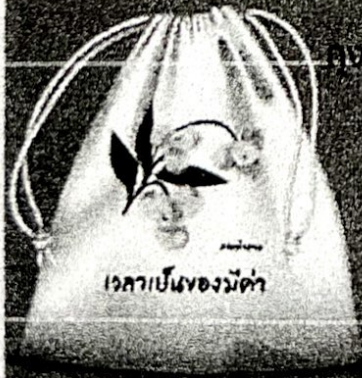
ถุงผ้าดอกลำดวน