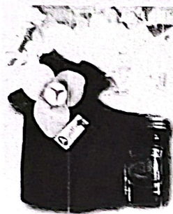
ย่าหม่องดอกกล้วยวน ราคา ๖๐ บาท