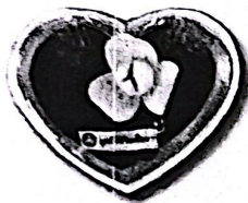
เข็มกลัดดอกกล้วยวน ในกล่องรูปหัวใจ ราคา ๕๐ บาท